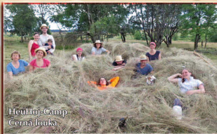
HeuHoj-Camp Černá louka