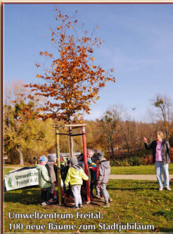
Umweltzentrum Freital: 100 neue Bäume zum Stadtjubiläum

... für deine Unterstützung, die Natur im Ost-Erzgebirge zu erhalten!