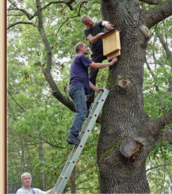
Praxistag der NATURA-2000-Gebietsbetreuer in Glashütte