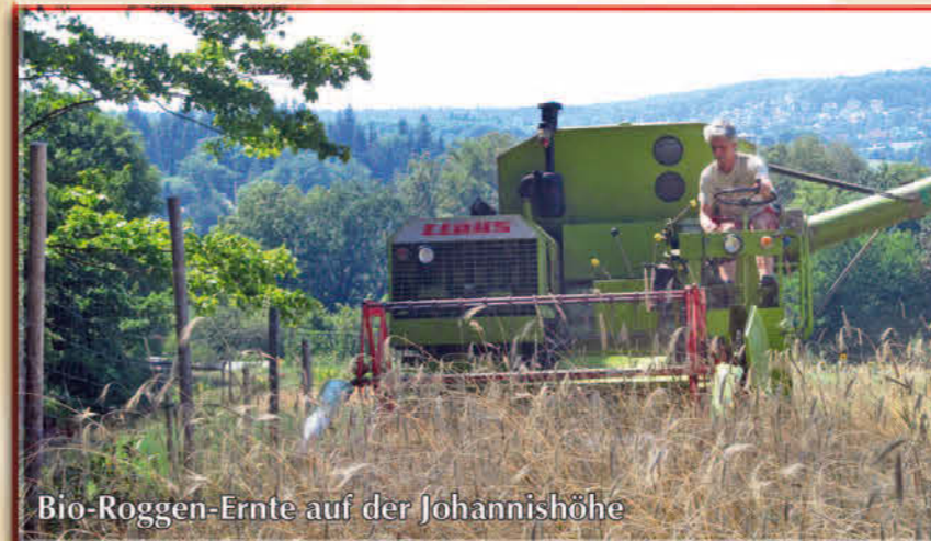
Bio-Roggen-Ernte auf der Johannishöhe