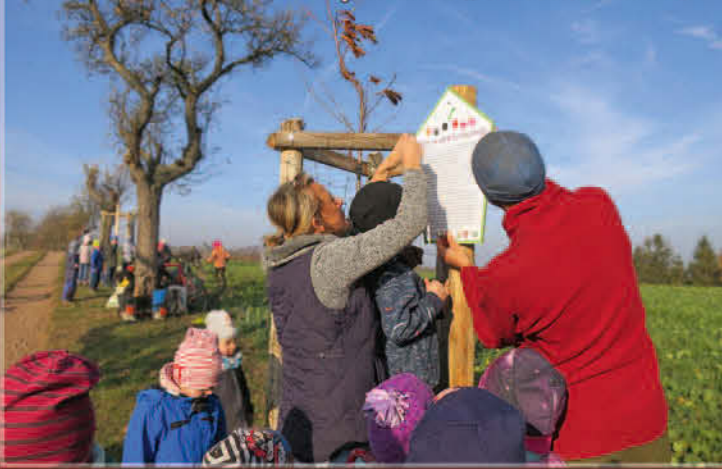
Aktionstag mit dem Kindergarten Cunnnersdorf an der Apfelallee „Alte Eisenstraße“