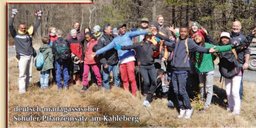
deutsch-madagassischer Schüler-Pflanzeinsatz am Kahleberg