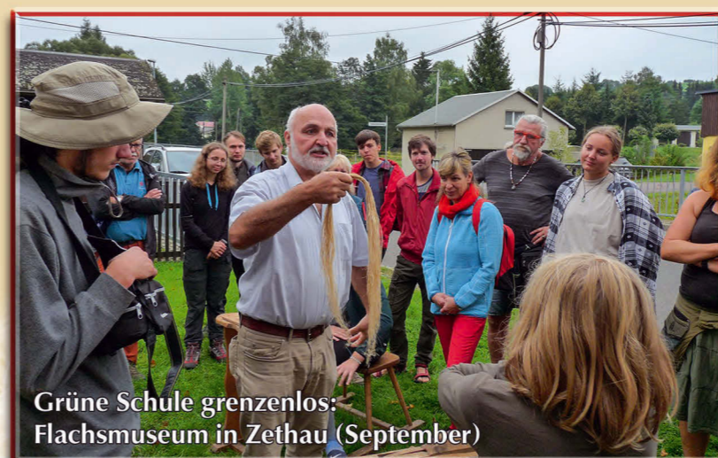
Grüne Schule grenzenlos: Flachsmuseum in Zethau (September)