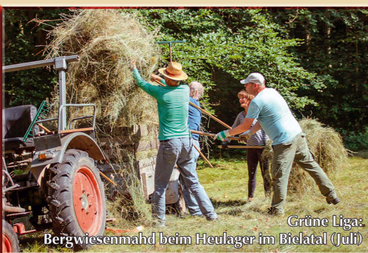
Grüne Liga: Bergwiesenmäh beim Heulager im Bielatal (Juli)