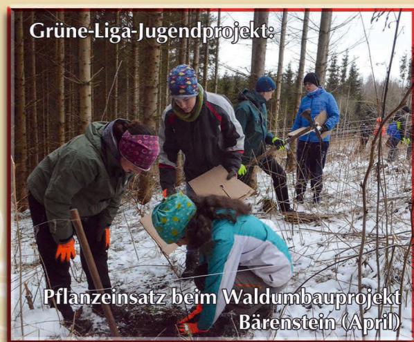
Grüne-Liga-Jugendprojekte: Pflanzeinsatz beim Waldumbauprojekt Bärenstein (April)