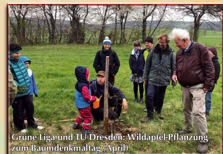
Grüne Liga und TU Dresden: Wildapfel-Pflanzung zum Baumdenkmaltag (April)