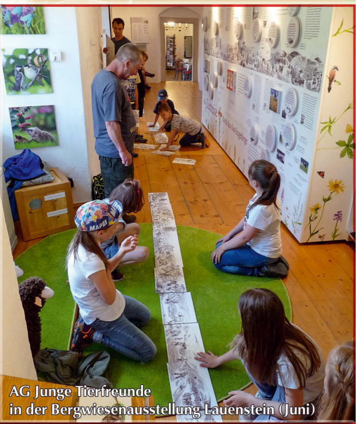
AG Junge Tierfreunde in der Bergwiesenausstellung Lauenstein (Juni)