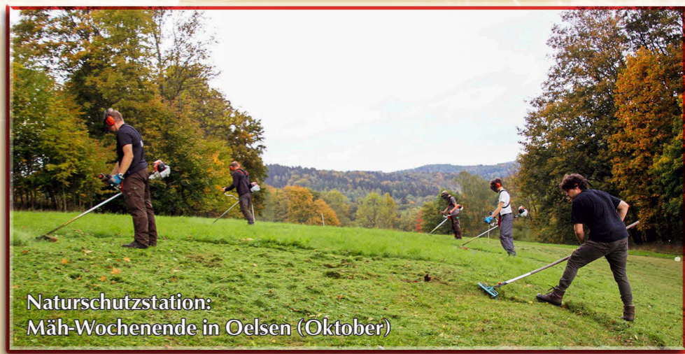
Naturschutzstation: Mäh-Wochenende in Oelsen (Oktober)