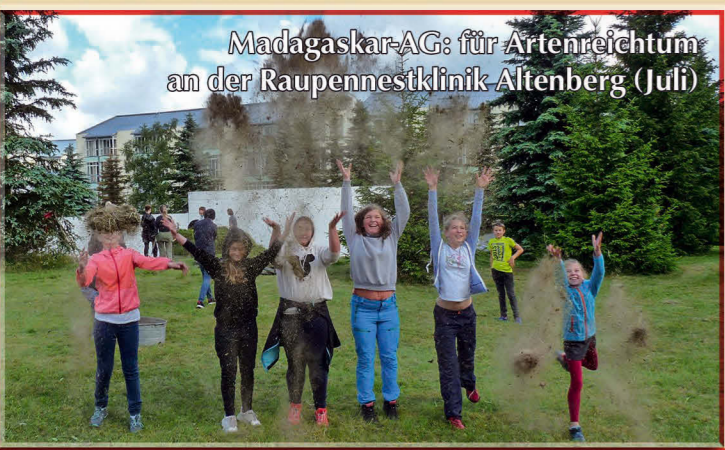
Madagaskar-AG: für Artenreichtum an der Raupennestklinik Altenberg (Juli)