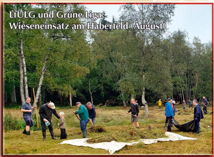
LfÜLG und Grüne Liga: Wieseneinsatz am Haberfeld (August)