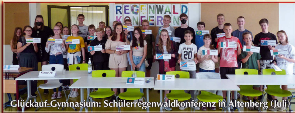
Glückauf-Gymnasium: Schülerregenwaldkonferenz in Altenberg (Juli)