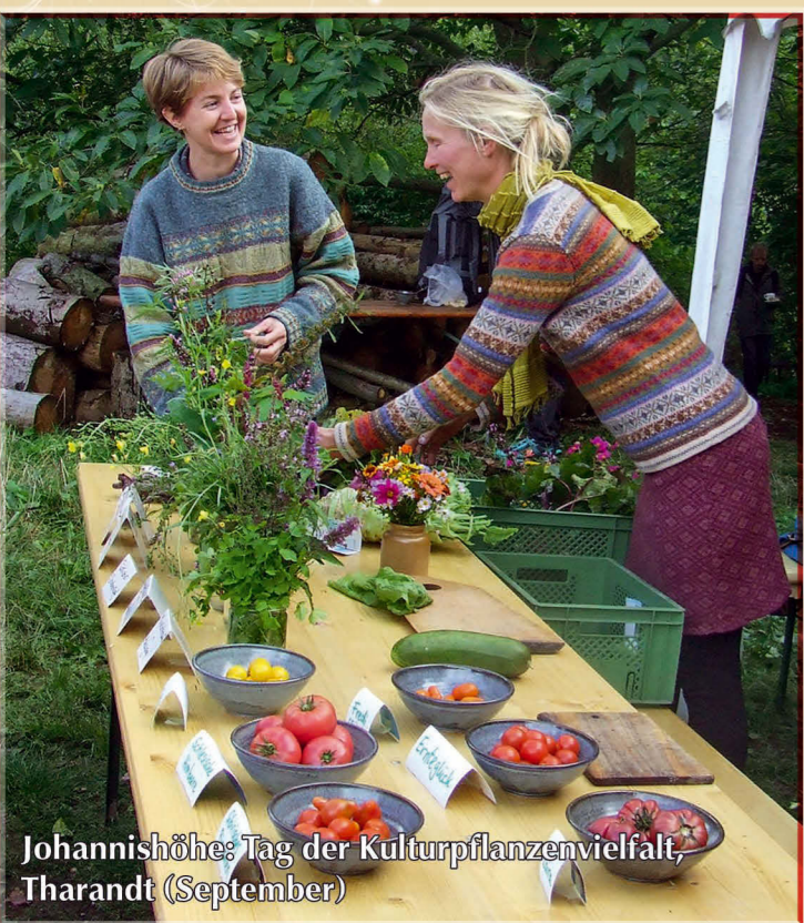
Johannishöhe: Tag der Kulturpflanzenvielfalt, Tharandt (September)