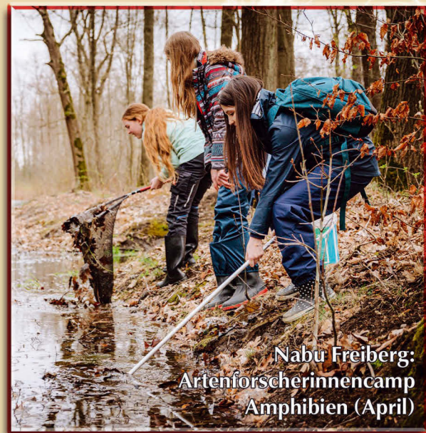
Nabu Freiberg: Artenforscherinnencamp Amphibien (April)